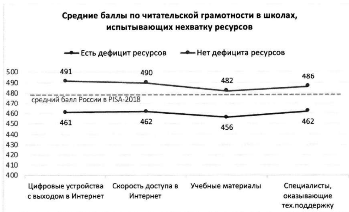
Рисунок 2. Дефициты ресурсов образовательной организации и результаты обучающихся по шкале читательской грамотности PISA относительно среднего результата РФ в PISA-2018

Дефициты ресурсов определялись на основании ответов администрации школ на вопросы анкеты и могут отражать субъективную точку зрения директора.